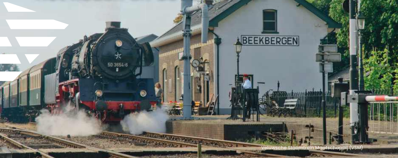
Veluwsche Stoomtrein Maatschappij (VSM)